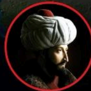
FATİH SULTAN MEHMET